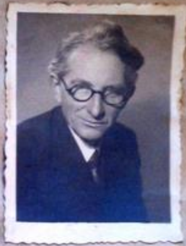
(Вільчинські Тадеуш. Особова справа // Архів ЛНМУ. – Спр. 17631.)

Universität in Lemberg Philosophische Fakultät Doktorat der Philosophie aus der Botanik und Zoologie.