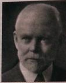
Е. Б. Вілсон

ка, ембріологія, зокр., дослідження філогенет. зв'язків різних організмів, один з перших зробив висновок, що гомол. органи різних організмів походять з одних і тих же клітин; клітин. біологія (уважають першим клітин. біологом), з'ясував роль хромосом у визначенні статі; один з перших вивчив статеві X і Y хромосоми, довів, що