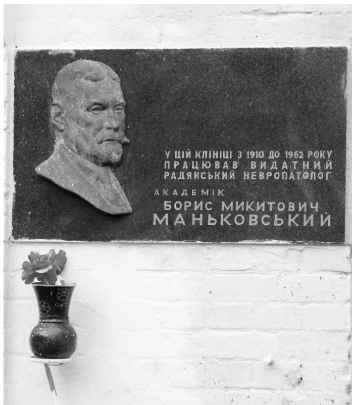
Пам'ятна дошка на фасаді Олександрівської клінічної лікарні (вул. Шовковична, 39, Київ)