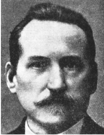
АНДРІЙ ГОНЬКА (Andrzej Gońka)

завдяки поєднанню передових знань і фахової техніки у Львові виникло сприятливе лікарське середовище й умови для зародження власної стоматологічної школи.