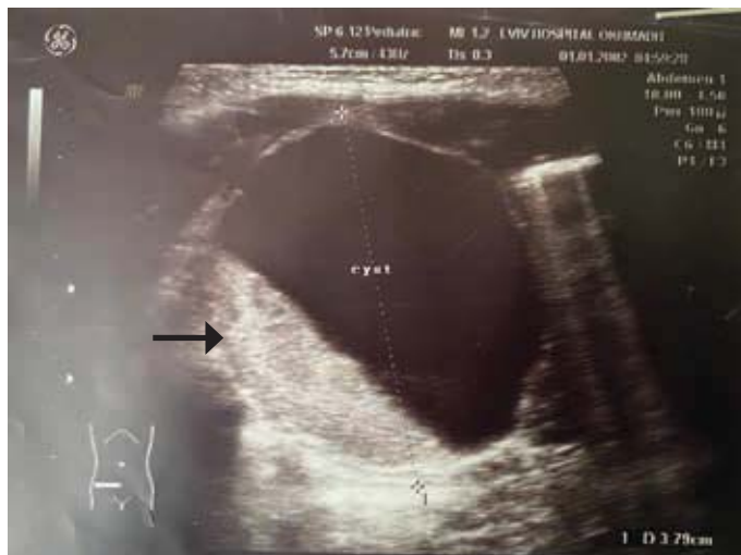
Рис. 3. Кіста правого яєчника з неоднорідним вмістом (стрілка)