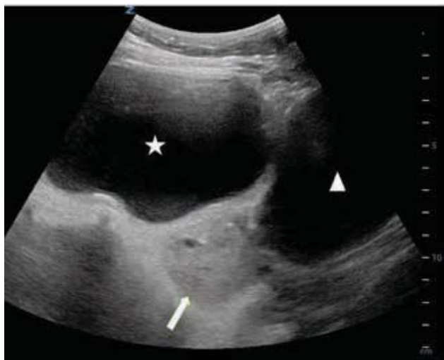
Рис. 2. Симптом «подвійної бульбашки». Гіперехогенний перевернутий яєчник (стрілка), розташований між сечовим міхуром зліва (зірочка) і великою кістою (трикутник)